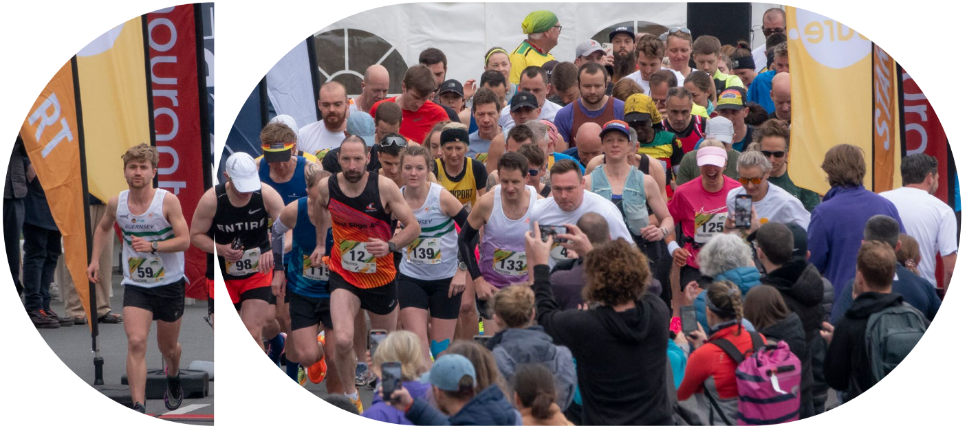
• رعاية مجموعة Sure لماراثون جرنسي.

منذ عام 2022، انضمت Beyon إلى تحالف اتصالات خليجي والذي يهدف إلى التصدي للتحديات البيئية ودعم الاستدامة في جميع أنحاء المنطقة. وفي عام 2023، أعلن أعضاء التحالف عن إطلاق مركز ابتكار الاستدامة والذي يضم مجموعة من شركات الاتصالات الرائدة من البحرين والمملكة العربية السعودية والإمارات وعمان وقطر، فضلا عن شركاء آخرين إقليميين ودوليين مثل نوكيا وإنتل. ويسعى المركز إلى تطوير وتنفيذ حلول مبتكرة للطاقة من مصادر الطاقة المتجددة الموثوقة وتقديمها بأسعار مناسبة، بما يمكّن المشغلين من خفض اعتمادهم على مصادر الوقود التقليدية، والانتقال إلى مستقبل أخضر.