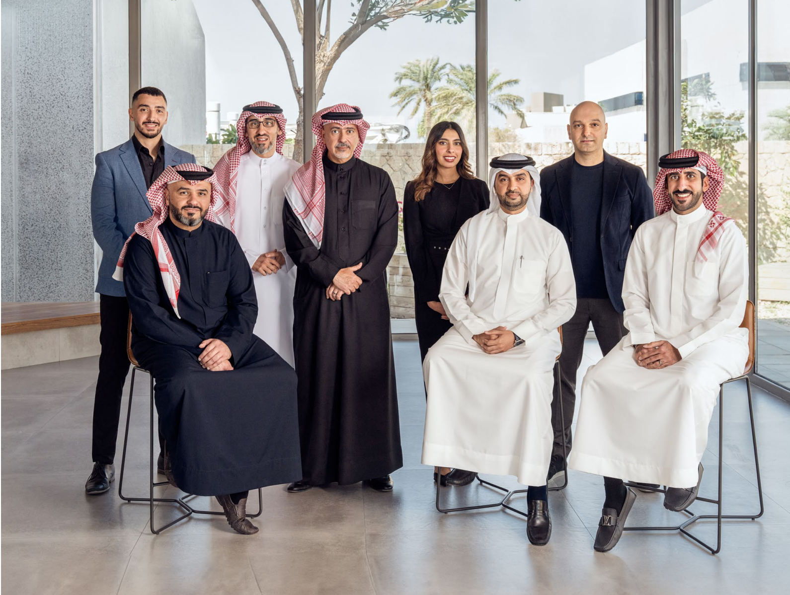
تمثل لجنة Beyon للاستدامة: بتلكو، Beyon Solutions، Beyon Connect، Beyon Cyber، Beyon Money.