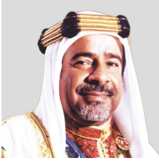
المغفور له بإذن الله تعالى صاحب العظمة الشيخ عيسى بن سلمان آل خليفة