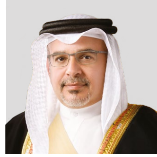
صاحب السمو الملكي الأمير سلمان بن حمد آل خليفة