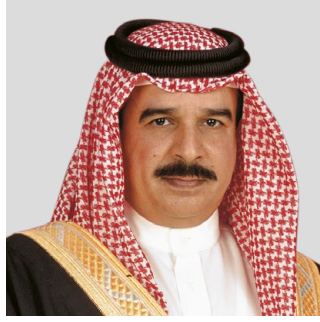
حضرة صاحب الجلالة الملك حمد بن عيسى آل خليفة